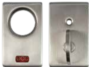
DM00X-PPRVIQ-ECYL Trousse d'indicateur d'occupation à cléage (Le cylindre n'est pas montré) Pour fonction 45, 56 ou 84