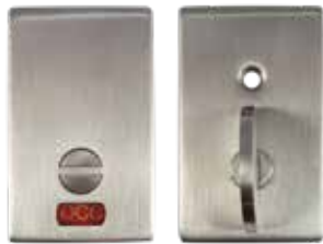
DM00X-PPRVIQ Trousse d'Indicateur d'occupation Pour fonction 42