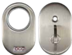
DM00X-PPRVI-ECYL Trousse d'indicateur d'occupation à cléage (Le cylindre n'est pas montré) Pour fonction 45, 56 ou 84