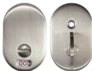
DM00X-PPRVI Trousse d'indicateur d'occupation Pour fonction 42